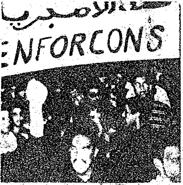
何蒙及利亞反美遊行

菲律賓親美官員主張，為了「反共」理由，應響應美國之呼喚而採取行動支持其在南越的戰爭，這種違背人民意願的主張，越來越遭到輿論界的反對。輿論界指出：南越現政府與民衆完全脫節，它根本不得民心，而美越人員利用戰爭串通貪污之事，是屢見不鮮的，難道這些親美官員要把我國人民捲進這場不名譽的侵略戰爭的漩渦嗎？