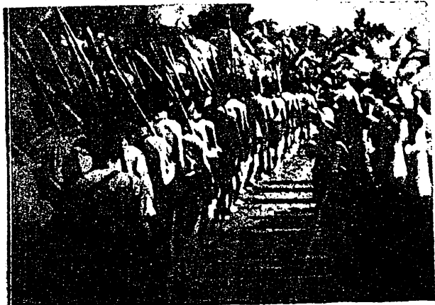
人民武裝隊伍寫字第兵

一九六一年五月，當時擔任美國副總統的約翰遜到南越去活動，同吳廷炎制定了在南越燃起戰火的“八點措施”。美國在南越所進行的所謂“特種戰爭”即始於此。隨後，美國侵略者就搞出了個“斯特利——泰勒計劃”，決定在一九六二年年底之前“平定”南越，結果以失敗而告終。到了一九六四年，又有一個所謂“麥納瑪拉——阮慶計劃”出爐，吹噓要在一九六五年年底以前“平定”整個南越，並且“根本消滅”人民武裝力量。可是，結果怎樣了呢？直到今天，美國侵略者不是越輸越慘嗎？現在，已經有五分之四的南越土地得到解放，解放區擁有一千萬以上的人口，而美偽統治者的地區，只剩下沿海大城市的幾塊小得可憐的地方。