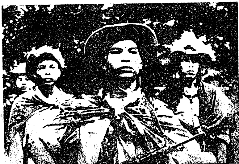
出發戰鬥前之越南南方民族解放陣綫戰士