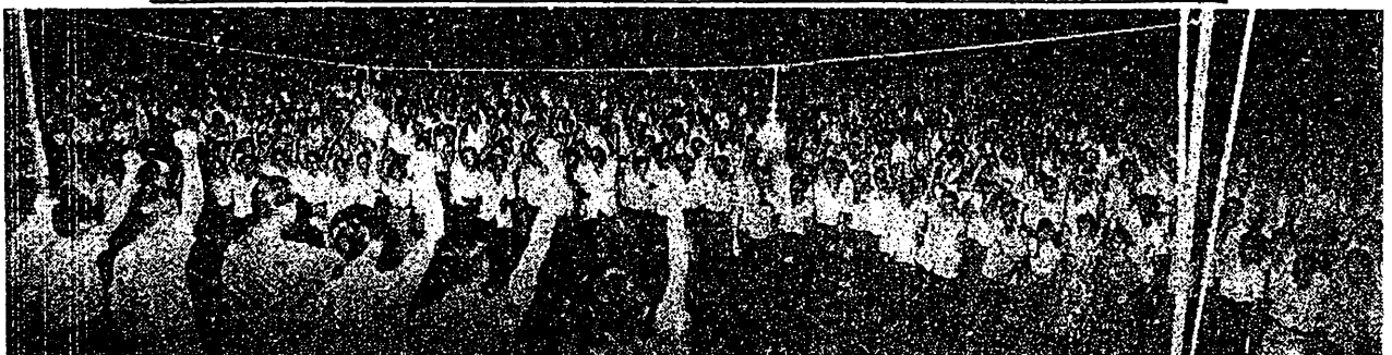
一九六二年十二月廿三日，我黨在芽籠好萊塢草場舉行聲援汶萊人民起義的群眾大會。在大會上，黨祕書長林清祥同志發表了「支持北加里曼丹人民的正義鬥爭」的重要演說。我黨主要負責人、職工會領袖，及人民黨領袖也都在會上作了精彩的演說。圖為大會結束前，群眾一致舉手通過三項重要決議之影。

誰也不會否認，北婆人民的鬥爭，目前還處在重重的困難下，新生力量還是在萌芽階段；但是，更不能否認的事實是，北婆人民的新生力量，必定要發展和壯大。只要北婆人民加緊團結，繼續與帝國主義者及反動派展開針鋒相對的英勇鬥爭，那麼，最終的勝利必屬於北加里曼丹人民。