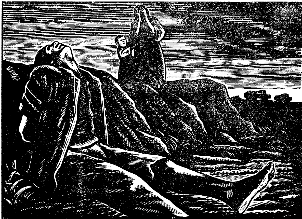
波新 (刻木) 人已自打去意願不他為因