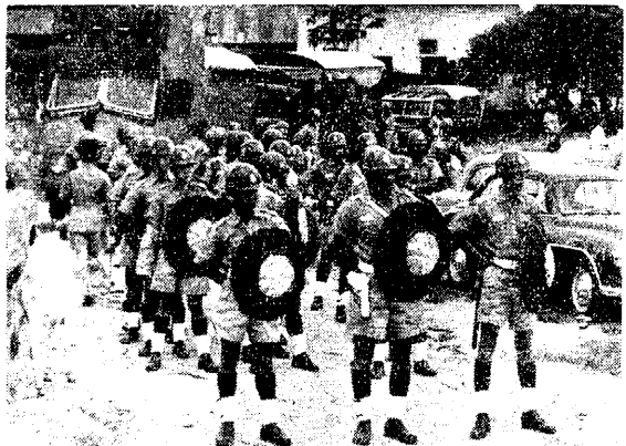
鎮暴隊嚴陣對峙，準備為資方開路。