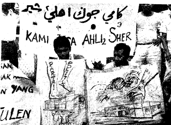
我們為報導自由，反對政黨控制！

關，這是違反了廿二年前該報創辦人的意旨與目標，他們認為該報一旦成為某一黨派的工具將會失去大部份各階層不同思想的讀者，影響報份銷數，職工們可能因此受裁員減薪等等之苦。於是職工們召開緊急會議後，於七月十三日向董事委員會提呈一份備忘錄，該備忘錄指