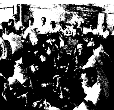
歡慶鬥爭勝利茶會一隅。

爭取的勝利成果，為了紀念這場具有深長意義的鬥爭，工友們特於五月廿一日在我會大坡區會所舉行慶祝大會。被邀請出席大會的除總會及區區負責人外，尚有在工潮期間積極援助罷工工友的「新加坡包莊運輸」工友，以及目前正在繼續進行鬥爭的永興食品廠和東榮來運輸工友。