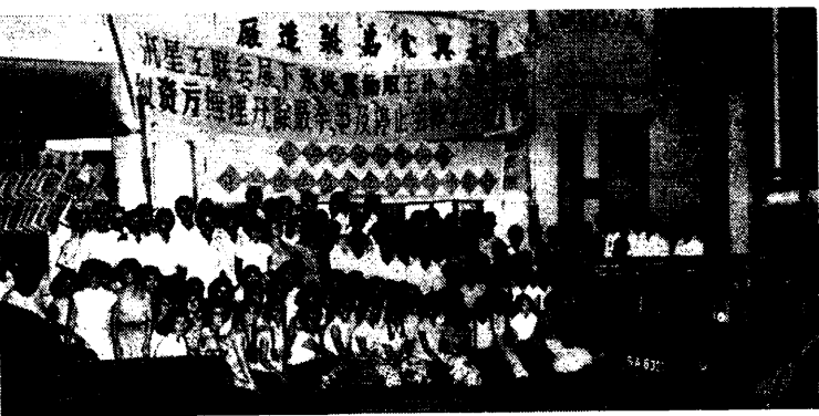
巴區廠幹事與鬥爭中之工友合影留念。

節目開始了，廠內更是喜氣洋洋，歌聲、笛聲、笑聲……更是頻頻向廠外播揚開去，吸引了不少的過路人士，圍集於廠前觀看。大家歡樂至十一時許，始在廠前拍攝一張集體照片，以為永久紀念。