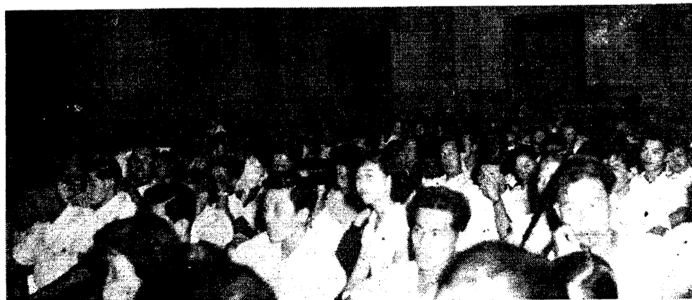
熱愛真理的幹事們 ——會場一隅——