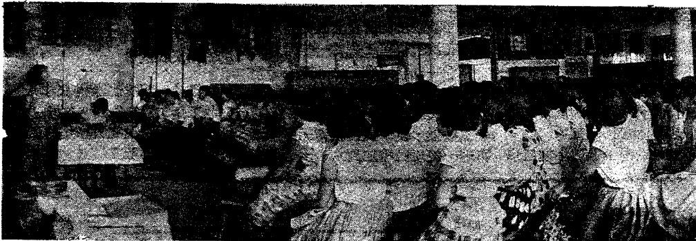
女幹事大會的熱烈場面

你看排排坐在一起的，就是來自不同工廠的優秀且肯幹的姊妹，她們就是產生力量的火花，每一顆火花可以在它墜落的地方，蔓延燃燒開去。她們是火種，也是力量，我們願她們的青春永遠閃着亮光！