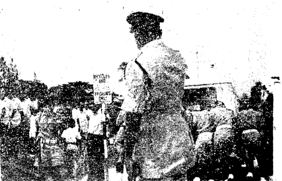
警方人員在倒彩聲中替軍車開路