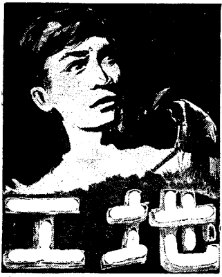
(印)蘇逸寧作 丘二虎譯