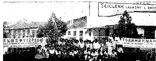
賽克玲機器洗染廠全體近百位男女工友經過五日罷工後終獲圓滿解決 以上是工友在廠外之影