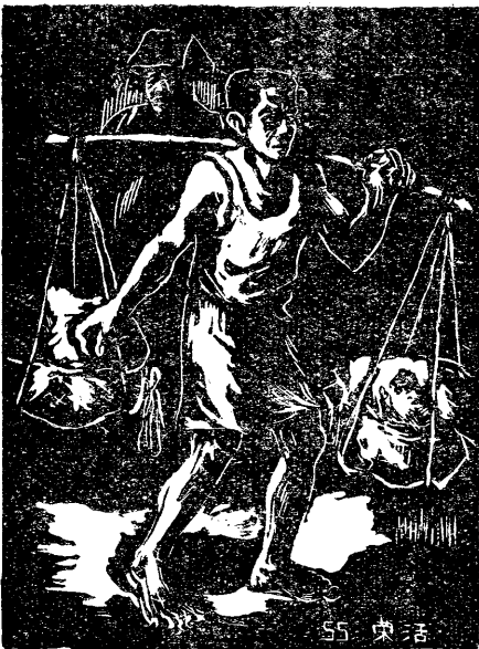
挑 活 祭 作

我認為目前工人雖過着困苦的生活，但需要繼續努力鍊鍛自己，使將來成為社會一個有用的人。