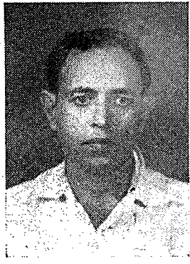
聯合邦國會在五月開會時曾提到本年五月初在新加坡工業仲裁庭突然結束的「哥耶案件」。

過。報導中說，聯合邦內政部長伊士邁正式否認會勸告「克拉班都報」將哥耶從編輯部職員中除去。「克拉班都報」是在新加坡出版的日報。