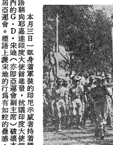
本月三日一羣身穿軍裝的印尼示威者，抗議印度大使館。...