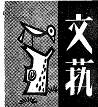
門閥有素質望自高