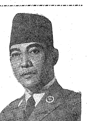
尼獨立七十年紀念卡諾諾諾諾諾...