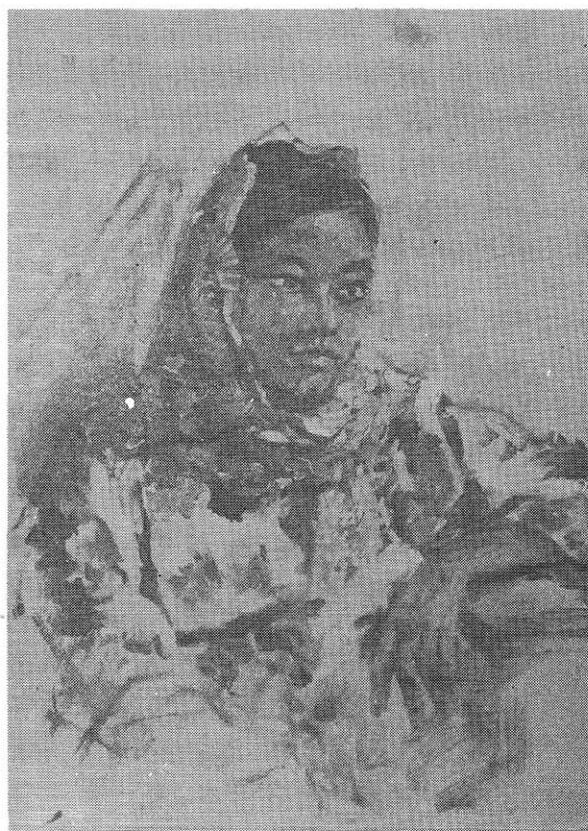
馬來姑娘 (油畫) 苗勇作