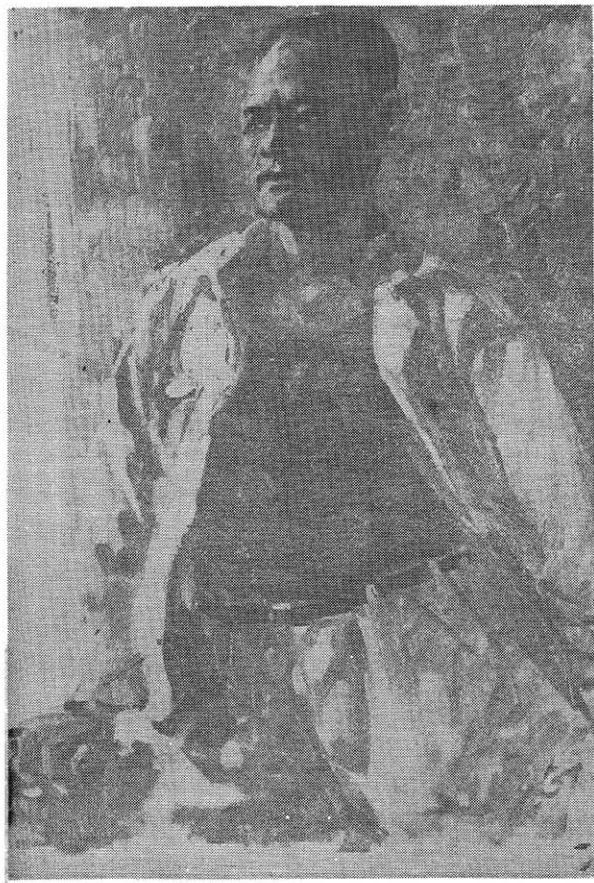
估 俚 (油畫) 苗勇作