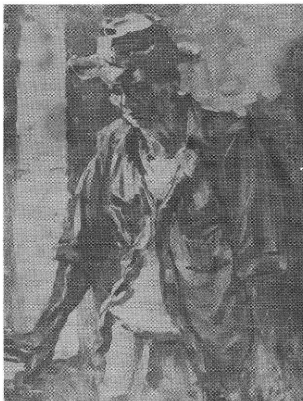
失業工人 (油畫) 苗勇作