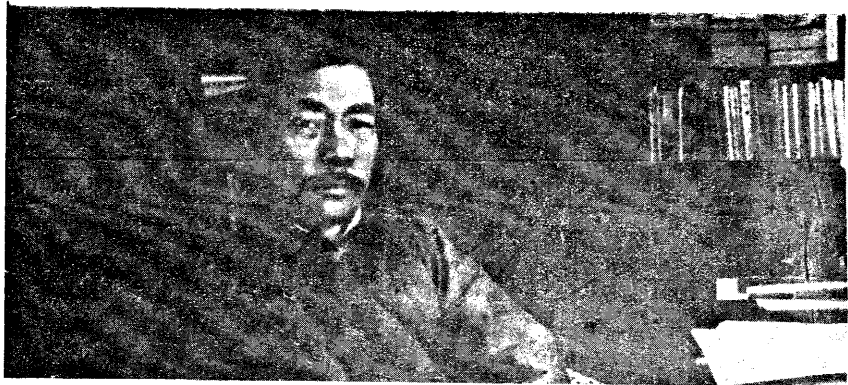
鲁迅在上海时的相片(1927年冬摄于闸北景云里寓所)