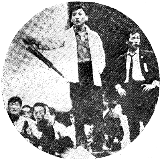
↑ 曾在四月起義時受傷的學生站在國會會議廳的講壇上高喊：『所有的國會議員滾出國會！』

不出所料張勉集團竟然開釋了大部分的兇犯，僅僅對其中幾名太惡名昭著的魁首判絞刑及極輕微的刑罰。對此種明目張膽地庇護兇手的罪行，南朝鮮人民豈能置之不理？