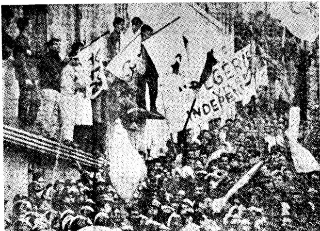
↑ 這是阿爾及利亞人民在爭取獨立而舉行示威遊行之一瞥。

法國總統戴高樂將軍最近的訪阿已經造成了屠殺的悲慘局面，並且也向世界輿論顯示了阿人民對獨立的渴求和他（她）們對