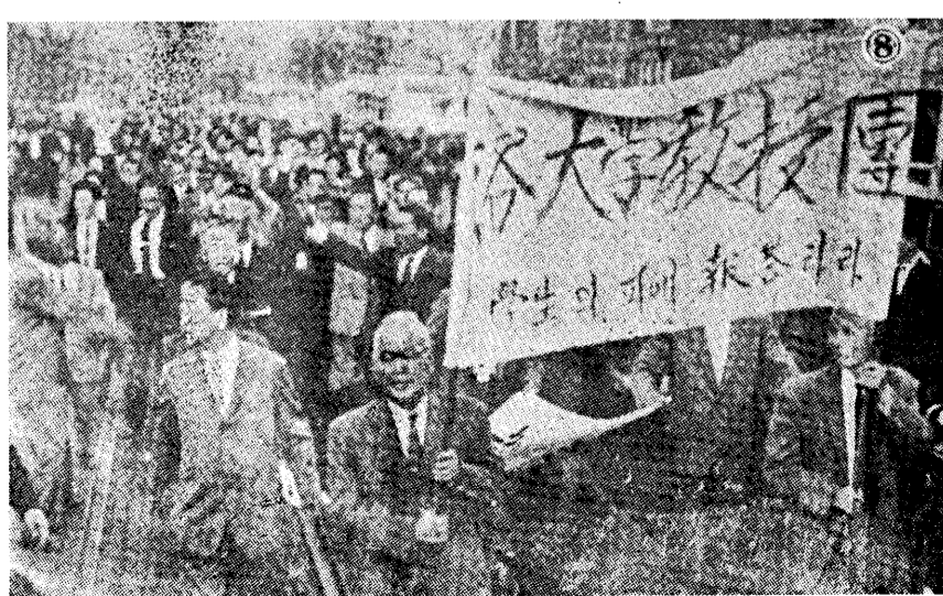
↑ 漢城各大學教授舉着『學生不應該白死！』的標語在遊行。