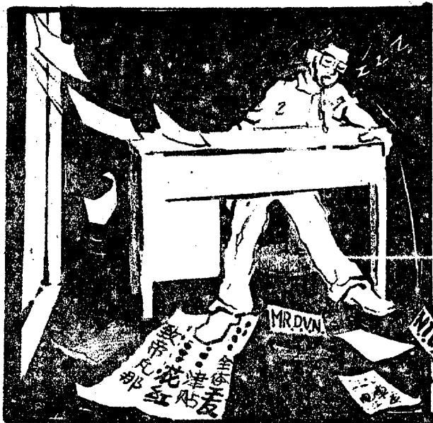
1. 「唔唔……无了生路，不行！不行！」