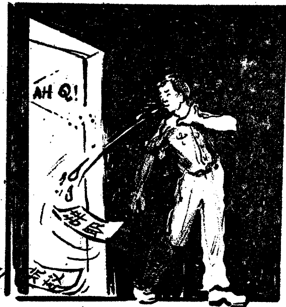
3. 「呸！亲共份子！冒险份子！……我呸！老子不用你们闹除了，还是跟老子辞职吧；嘿嘿！辞职就是抗敌呀！」