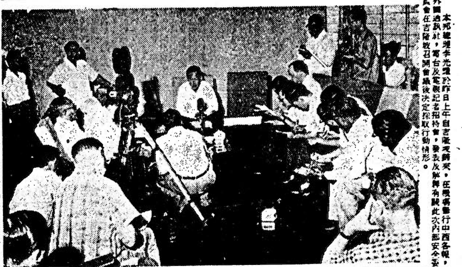
本報總理李光耀於昨日上午在吉隆坡與記者會晤，任職舉行內閣會議後，在吉隆坡與記者會晤，任職舉行內閣會議後，在吉隆坡與記者會晤。

任何時候 反擊 李總理在吉隆坡記者招待會中，對任何時候反擊的問題，作詳細闡明。李總理在吉隆坡記者招待會中，對任何時候反擊的問題，作詳細闡明。