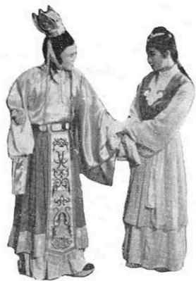
← 子蘭公子拉着嫺娟的手說：「嫺娟，我們坐着談談心吧！」