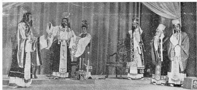
↑ 國王回宮時一見屈大夫扶着南后，以為非禮，怒不可遏罵道：「誣陷？我誣陷你？南后她誣陷你，我還能相信得過我自己的眼睛啦。」