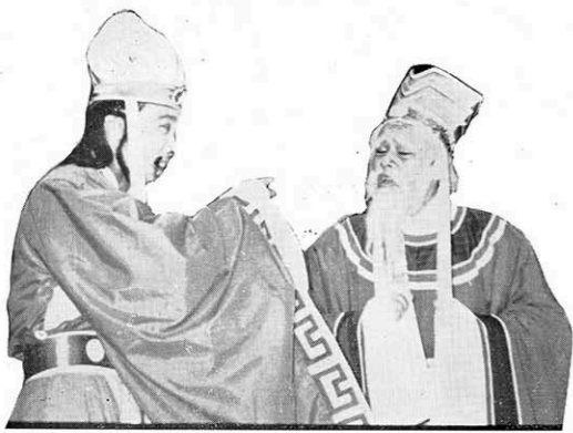
↑ 上官大夫新尙說他親眼看見屈原在宮庭里擁抱着南后要與南后親嘴呢。