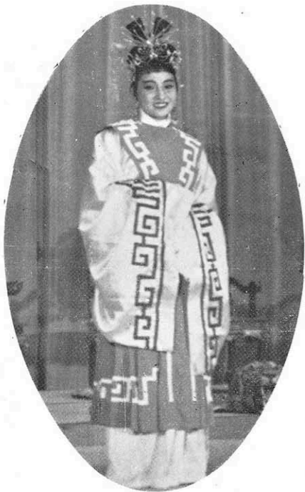
← 這是懷王的愛妃鄭袖——南后；權張儀所說：「天地間實在是不會有第二個的。」