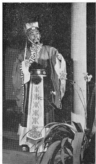
← 上官大夫新尙：「哦，令尹也到了，又是一位見識到了，你們快把路讓開。」