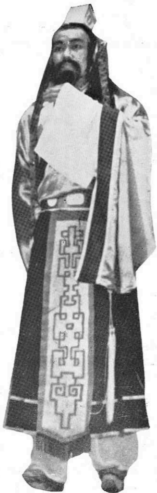
屈原：「我們生要生得光明，死要死得磊落。」