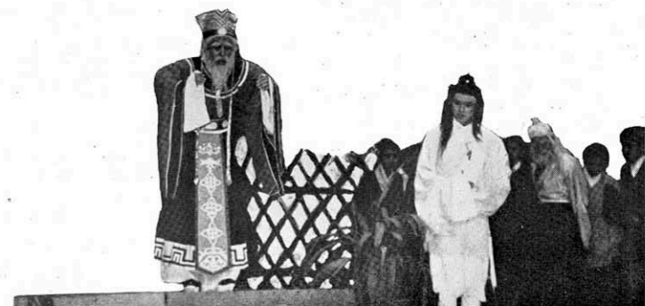
↑ 昏庸老朽的子椒要宋玉去請位巫師來替先生招魂。