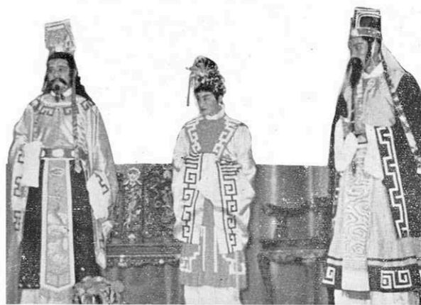
↑ 張儀陷害屈原之後，又說：「今天第一次拜見南后，才明白——屈原為甚麼要發瘋了。」