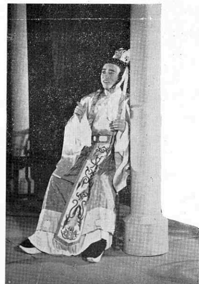
→ 子蘭公子妙想天地說：「我爸爸喜歡我媽，我媽又喜歡我，只要我媽是高興我做國王，你怕我做不成國王嗎？」