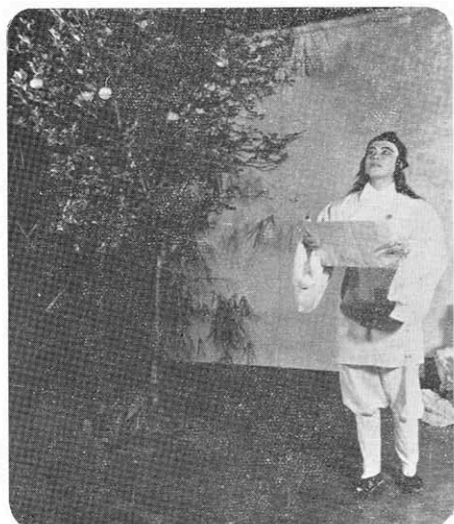
← 宋玉在園里放聲朗讀屈原的詩篇——橘頌。