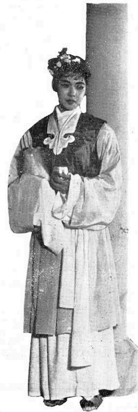
← 嫺娟：「我是一個普通人家的女兒，我是先生的侍女，我的責任是服事先生，是洒掃庭堂……但我知道先生的存在關係着楚國的安危……先生如果死掉，那我們的楚國就會完了。」