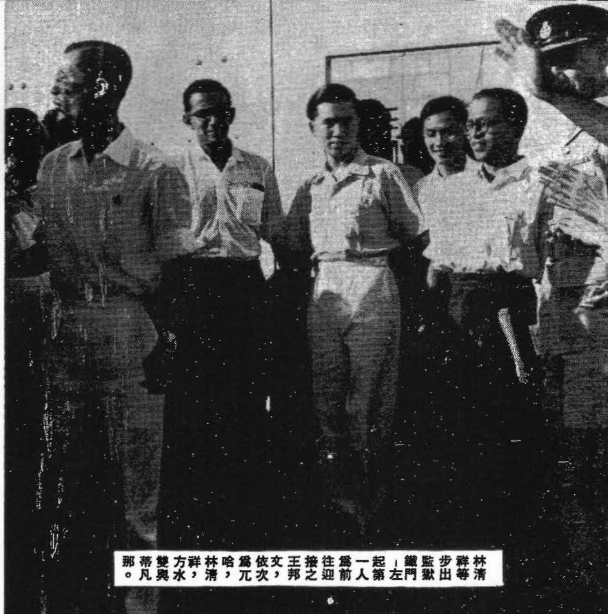
那帶雙方祥林哈爲依文王接往爲一起，鐵監步祥林 。凡與水，清，兀次，邦之迎前入第左門獄出等清