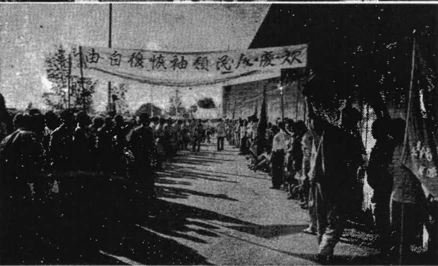
。路標和旗、列行的由自復恢等氏林迎歡是盡，外門鐵