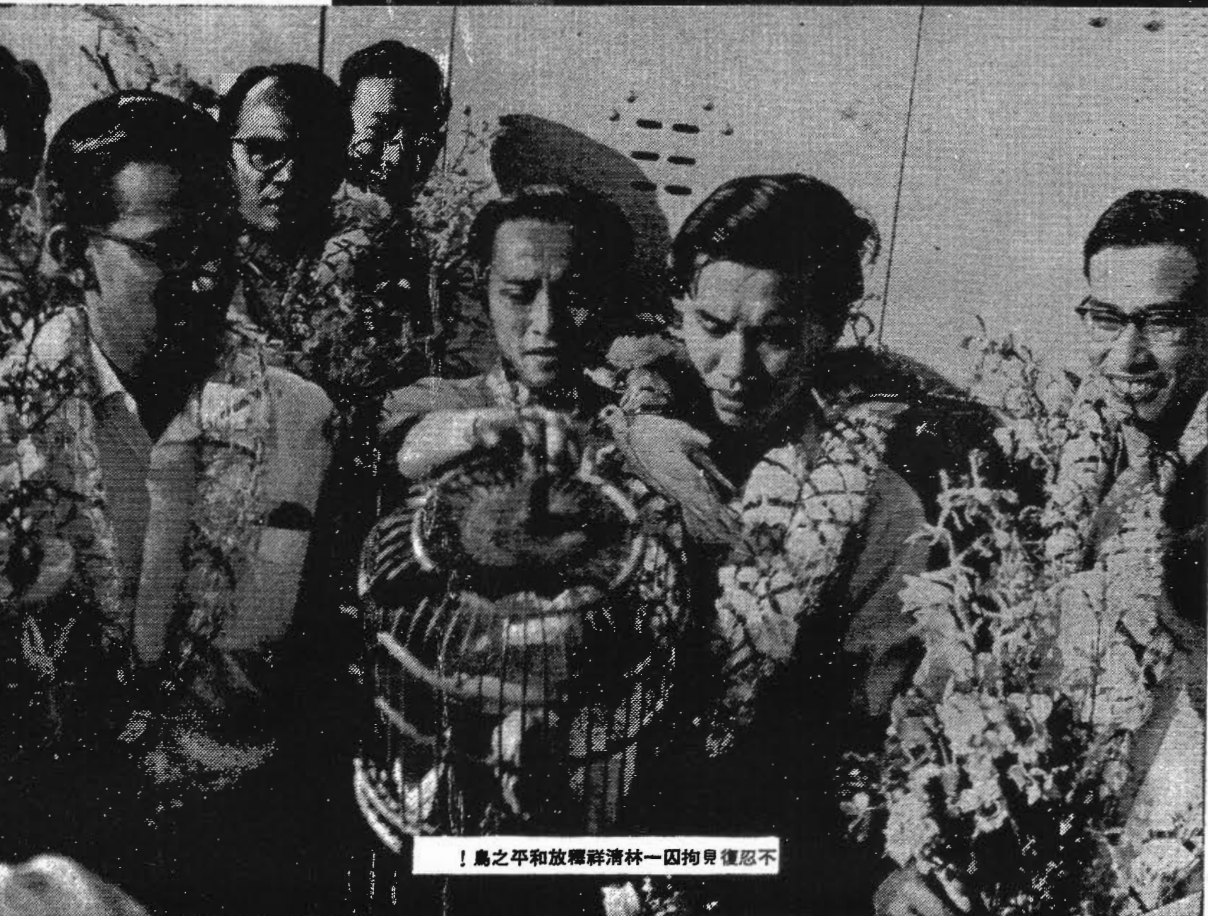
！鳥之平和放釋祥清林一囚拘見僅忍不