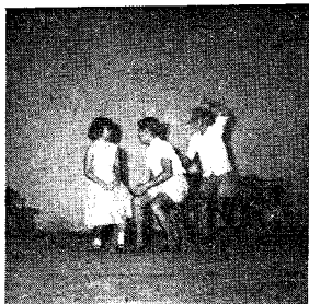
楊主任：密斯奇，你已經準備結婚了嗎？……」

事情終告大白，張先生在被蓋內對楊主任憤怒已達極點，掀起被蓋，想痛罵楊主任一頓！幸好未婚妻應付有術，衍囊有方，總算應付過了；沒想到二房東剛巧又跑進來，四個人碰在一道，發生不少誤會，結果房子租不到，而未婚妻的書記職位也告吹了。