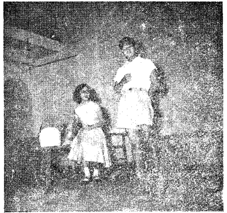
密士奇：「這都是主任的優待……」

恰巧！這事被村裏的一個少年知道了，他運用了他的智慧，把小女孩救出了，並且，爲了尋回往日幸福的生活，他招集了村民們，聯合把這萬惡的「怪物」驅趕出去，從此，幸福的歌聲又响