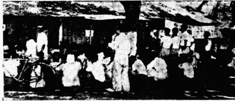
各業工聯屬下各工廠工友昨日下午停工，抗議政府之舉。圖為抗議現場之一景。

【本報訊】中學生代表昨日表示，將繼續支持政府之政策。此舉顯示了青年一代之愛國情懷。