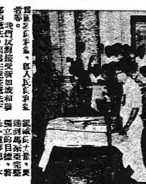
李光耀律師解釋建黨宗旨