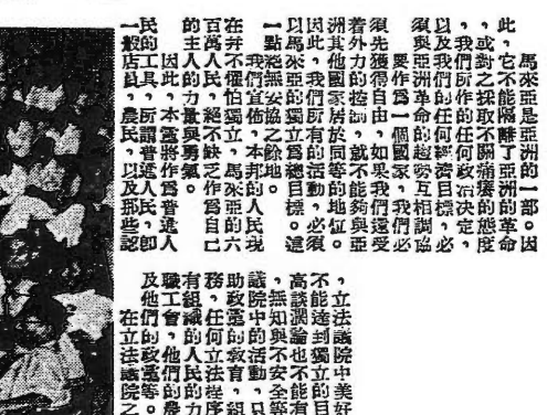
人民行動黨臨時主席杜進才致詞

李光耀開會詞。李光耀在致詞中，首先對到會者表示歡迎，並對大會的順利舉行表示祝賀。他強調，人民行動黨的成立是馬來亞歷史上的重要事件，這標誌著馬來亞人民開始了爭取獨立的鬥爭。他呼籲全體黨員團結一致，共同為爭取獨立而奮鬥。最後，他宣佈大會圓滿結束。